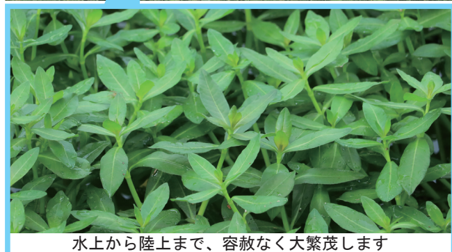
水上から陸上まで、容赦なく大繁茂します