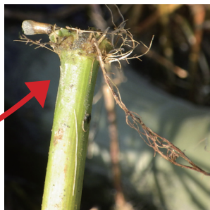
茎の節から再生する根