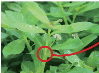
節は簡単にポキポキ折れる